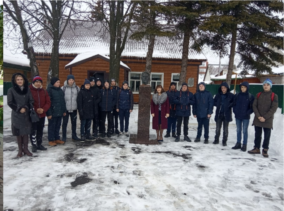
Экскурсия с группой в Дом-музей Героя Советского Союза М.П. Девятаева