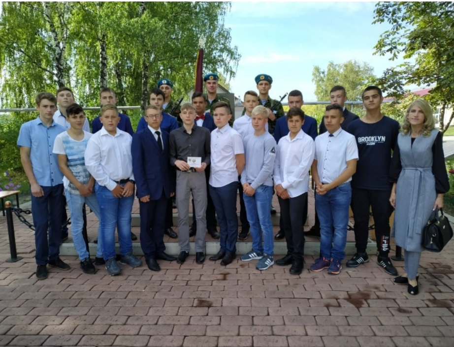
Студенты группы специальность «Электрификация и автоматизация сельского хозяйства»